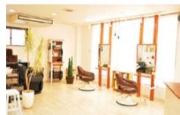
イオン茨木の斜め向かい。ビル入り口の階段を上がってドアを開けると、自然光の明るい店内。