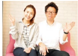
夫婦で営むほんわかした雰囲気の落ち着いた美容室。店名「フリカケ」の由来を聞いたら…思わず和んじやう!

「髪が細くなって、幸薄な印象…」そんな人はフリカケにお任せ!髪に負担をかけない巻き方や、丁寧なオーナーカットで「スタイリングが楽で夕方になってもつむじ部分がふわっとしている」と好評だ。薬剤にこだわり、カラーやパーマには髪を守る”栄養補給 トリートメント”をプラスしてくれるから、ダメージヘアも手触りのよい艶髪に!髪悩みを相談して若々しいスタイルを叶えよう。