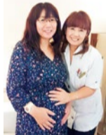
当院に通い2人目を妊娠された患者さんにとり笑顔で。

「体外受精でも授からない…」という方にも評判で、多数の実績を誇る同院。まずは不調の原因を探り、一人ひとりに適した施術を施してくれる。N.O.E(高周波治療器)で細胞を活性化させ本来持つ「妊娠力」を高め、さらに鍼灸(無痛療法)で体本来の力を取り戻していく。不妊カウンセラーの資格を持つ女性スタッフがいるので、東洋医学に限らない幅広い相談も可能。事前予約で子連れOKなので、2人目不妊に悩む方にも通いやすく安心。遠方から通う患者さんが多いのも納得だ。