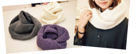
スヌード(ぼこぼこウールニット)

各1,920円(グレー・ホワイト・パープル) 簡単な縫い合わせで作れるスヌードセット。巻き方も簡単でぐるぐると2重に巻くだけ。この秋冬のおすすめアイテム。