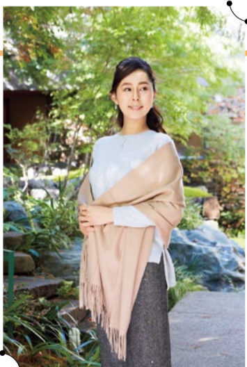
カシミア大判ストール(28,080円) カシミアスヌード付ブルオーバー(42,120円)