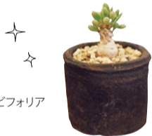
オトナグラビフォリア 6,480円~

約700日限定のグリーン&雑貨店。育てやすい小ぶりのものから、海外産のレアなものまで豊富なセレクトが魅力。2Fではコーヒーをはじめ、ワインやビールも楽しめる。コーヒーを飲みながら、色々質問してみるのも面白い。