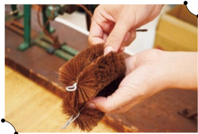
専用の道具を使用。つ ひとつの工程を丁寧 に仕上げるのがコツ