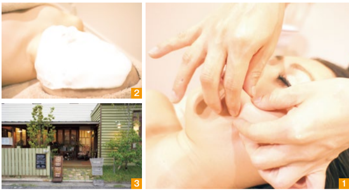
1.顔には30種類以上の筋肉があるそう。筋肉を細かく刺激する顔筋マッサージで、たるみ・シワの改善や小顔効果も。 2.肌の負担が少ないゲル化粧品を使用。肌に潤いを与え、艶やかな肌に。 3.木のぬくもりを感じる一軒家サロン。心地の良い音楽に、癒しの香り。店内はゆったりとした時間が流れる。

今年の9月、打出駅近くにオープンした「TEATE(テアテ)」。10年以上のサロンワークとエステ講師の経験を持つエステティシャンが、高い技術と確かな理論に基づき、一人ひとりに合わせたトリートメントで、健やかな「美」を提案してくれる。同店のこだわりはオールハンド。手だけで繊細な深層リンパに働きかけることで老廃物を排泄し、人間が本来持っている自然治癒力や免疫力を高め肌質改善へと導く。12月末までシティライフ読者限定で、「冬対策!潤い小顔フェイシャルコース」を用意。ぜひ、この機会に試してみよう。