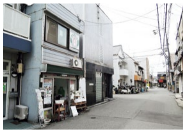
住宅と店舗が混在する通りにある「しょうないガダバ」

現在メンバーは15名ほど。母親の練習を聞いて娘も始めたという親子メンバーも。他グループと共に地域のイベントに出演することもある。