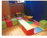
大人気のキッズスペース!ベビーカーもOK!

本格派珈琲、パン食べ放題ランチが人気のカジュアルイタリアン。キッズスペースもあり、ママ友とのランチにもオススメ。子連れ予約で子どもジュースサービスも。新登場のジャガイモと豆乳のクリームパスタはクリーミーでヘルシー!ドリンク+150円で愉しめる菓子膳などスイーツメニューも充実。