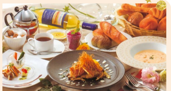
「ランチの女王コース」(全6品)1,290円～(税別)。スープ・前菜3種盛り合わせ・メイン4品より選択・デザート(4品より選択)・焼き立てパン食べ放題(ライス)・飲み物。 ※男性もOK・16時まで・土日とも提供

ソースや彩りに趣向を凝らした「ランチの女王」と、秋の味覚を織り交ぜた「季節のコース」。両コース共に、食べ放題の焼き立てパンがつくのも嬉しい。大切な記念日には、リクエストできるピアノ演奏などでサプライズを。