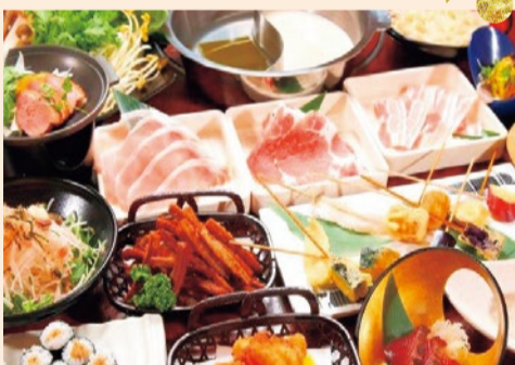
特選豚は肩ロース、ロース、バラ、鍋野菜は盛り合わせのほか8種類。唐揚げやポテトなどの揚げ物、寿司、5種類の揚げたて串天、サラダ、季節のおすすりメニューにデザートも。

特選豚しゃぶしゃぶをはじめ、全70種以上が食べ放題という大満足のメニューに飲み放題がついた宴会プランがおすすめ! 特選豚コースやバラのほか、定番の揚げ物や新鮮なお寿司、デザートなど盛り沢山。