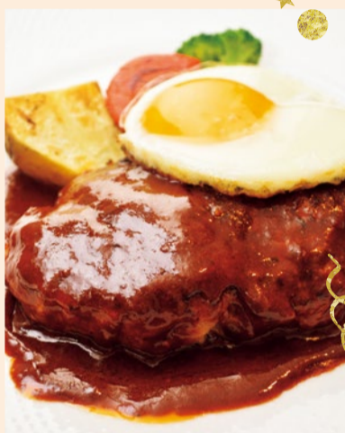
黒毛和牛と国産豚を使った旨みたっぷりのハンバーグは、「さくらのlunch de 忘年会」のメイン料理でチョイスできる。じっくり煮込んだ自家製デミグラスソースと共に味わって。

石窯を使った料理など本格洋食をいただける同店では、昼夜それぞれお得な忘年会メニューが登場。料理はもちろんのこと、ウェルカムドリンクから食後のデザートまで、しっかり堪能できるプランで楽しい時間を味わって。