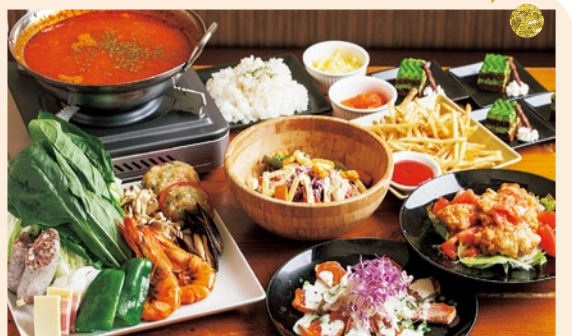
イタリアン鍋コースはメインの鍋にシーザサラダ、本日のカルパッチョ、フライドポテト、チキンフリットガーリック炒め、リゾット、デザートとボリューム満点で満足必至!

創業以来の名物、イタリアン鍋はトマトの旨みを引き出した絶品鍋。野菜と魚貝の旨みも溶け出した濃厚スープはそのまま味わいたくなるほど。美容にもオススメ、Pのリゾットまで大満足。お昼のママ友会も夜の宴会もOK!