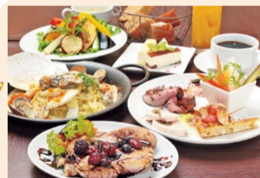
「ランチ女子会プラン」前菜5種/サラダ/スープ/鶏肉メイン/バスタ/デザート/パン食べ放題又はP/リゾ/ピザ/ソフトドリンク8種飲み放題 ※内容は仕入れによって異なる