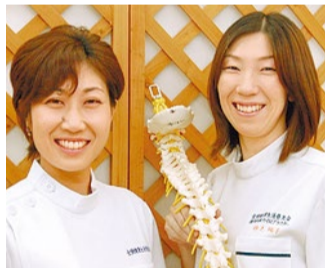
骨盤ケアは産後約3週間後からOK。幼児、赤ちゃん連れ大歓迎!

特典 | 「シティライフを見た」と新規予約の方 ●痛み改善カイロプラクティック……………5,500円→ 2,500円 ●女性特有、骨盤ケア ……………5,500円→ 2,500円 (12月末まで)