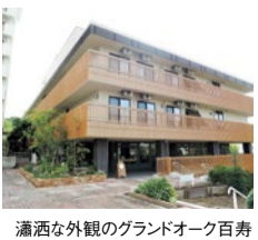
瀟洒な外観のグランドオーク百寿