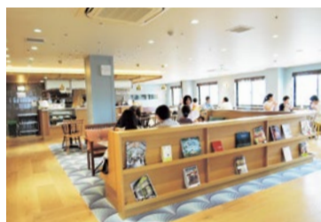
地域に開放された明るいカフェ