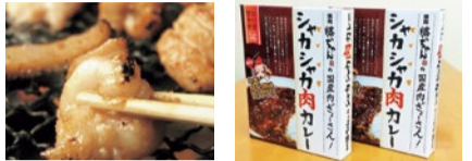
新鮮な国産ホルモンがたくさん味わえるのも魅力。自家製の味噌だれで味わうホルモンはやみつきになる旨さ。