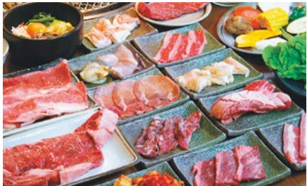
国産牛も食べ放題!新鮮なお肉を食べただけ注文できる。パバに嬉しい飲み放題コースも!