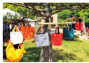
古道具ライムミックス 帆布バッグ、革財布等の革小物