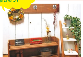
緩里 wood雑貨・ガラス絵やアクセサリ等