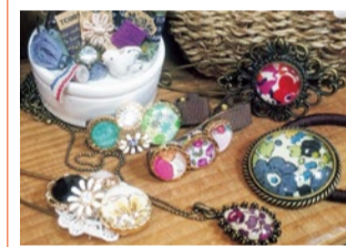
Kt2 ハンドメイドアクセサリ・資材、小物雑貨