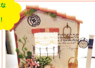
HR2 ハンドメイド雑貨 カントリー雑貨 木工ハウス雑貨