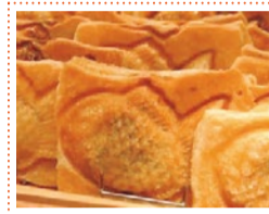
クロワッサンたい焼き