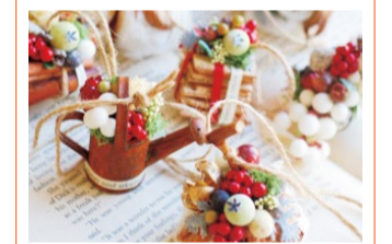
VERT DE GRIS ドライ、プリザーブド、アートの作品や雑貨、木の実やベリーを使ったワークショップ