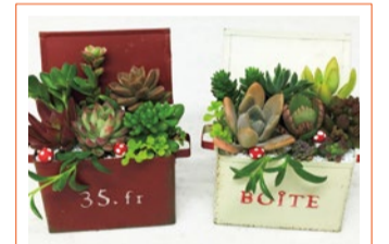
Merry Bell 多肉植物の寄せ植えと可愛いガーデン雑貨の販売