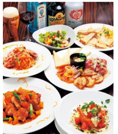
※写真は宴会コース3,500円

ボリューム満載のコースメニューは集まりの多いこの時期にぴったり。キリン一番搾りのプレミアムが飲める飲み放題も、種類が豊富に用意されている。広々とした店内なので利用しやすく、35名以上で貸切可能なので、大人数でもゆったり楽しめる!