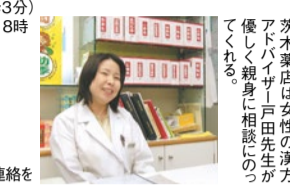
漢方瑞雲 高槻薬店 高槻市芥川町1-11-1(JR高槻徒歩3分) 水曜・講習会日休 相談/10時~18時 ☎072-686-0090

漢方瑞雲 高槻薬店 高槻市芥川町1-11-1(JR高槻徒歩3分) 水曜・講習会日休 相談/10時~18時 ☎072-686-0090 国際漢方 茨木薬店 茨木市真砂1-11-35(平和堂1F) 無休 相談/10時~18時 ☎072-638-9939 ※各店、予約制の為相談前に一度連絡を