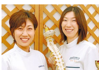
幼児や赤ちゃん連れ大歓迎で、骨盤ケアは産後約3週間後からOK!姿勢の悪い子どもの対応もしてくれる。

代謝が悪く、風邪を引きやすい人は骨盤に歪みがあるかも!体の歪みは体内循環を悪化させるそう。酷くなると血管や神経、内臓を圧迫して生理痛・不妊症といった婦人科疾患の一因にも。同院は多くの女性をサポートしてきた先生が、手技で骨格の歪みを整えてくれる。