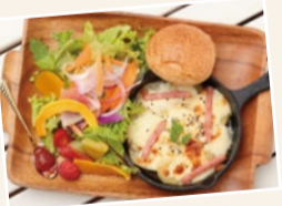
7時半~11時まではモーニングも。写真はポテトチーズ(700円)、ドリンクもセットに。