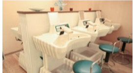
ゲルマ温浴中は美顔ストレッチや美容情報も教えてくれ、リラックスしながら充実した時間が過ごせる。

「今年こそ本気で痩せたい!」という人におすすめの「短期決戦!2ヵ月ダイエットコース」。メディアでも話題の「幸恵塾」がこれまでのノウハウを結集させ、女性らしいパランスの取れたナチュラルなボディラインを目指す内容だ。まず、体幹を鍛える「骨盤矯正」、軽い負荷でも結果が出る「加圧トレーニング」、脂肪燃焼を促進