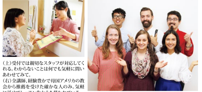
(上)受付では親切なスタッフが対応してくれる。わからないことは何でも気軽に聞いてみて。(右)全講師、経験豊かで母国アメリカの教会から推薦を受けた確かな人のみ、気軽に話せてレッスン生からも慕われている。