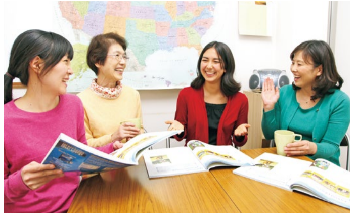
ハワイ出身のレイ先生のクラス。レッスンは、近況など身近な話題をテーマにした英語によるフリートークからスタート。先生や仲間と非日常の時間を過ごせて、「忙しい日常のリフレッシュになる」との声も。