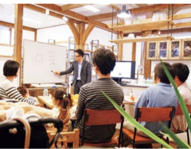
セミナー後は相談タイムもあり。気軽に相談しよう。