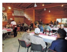
木のぬくもりのカフェ

西脇市に月に1日だけオープンする不思議なカフェがあると聞いて出かけてきました。篠山市に近い市民農園「すみよし桃源郷」。山小屋風の管理棟に入ると、ピンクのTシャツ姿の女性たちの笑顔に迎えられました。10年前、人口減少と高齢化が進む中で、気楽に集まれる場所をつくるという女性16人が意気投合。食器類は蔵、花は野にあるものを用いて、月に1回のカフェがスタート。口コミで増えた外からの来場者のリクエストで食事も始めた。近年の利用者は60〜80名。地産産の野菜を用いたランチが好評