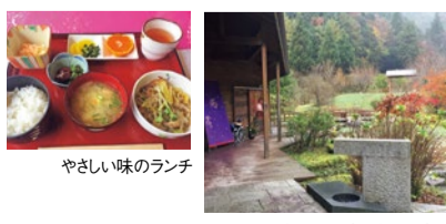
やさしい味のランチ

「神戸の垂水から来ました。ここは緑の中を気持ちよく走れ、休憩や食事もできるのがいい。」月1回のカフェを心こめて準備する女性たち。そのカフェを心待ちにしてはるばる訪れる人たち。それがまた彼女たちの元気にもなっている。次は雪が降った頃にまた来よう、そう思いながら千里へ車を走らせました。