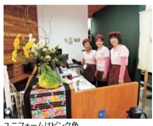
ユニフォームはピンク色

「△」を、余裕で解ける「○」になるよう重点を置くこと、子どものやる気がアップします。また、取り組む時間もポイント。子どもが元気でやる気のある時間帯に「△」や苦手な問題に挑戦します。解けない「×」問題は翌月「△」にすることを目指しましょう。また、暗記学習は夜寝る前に、翌朝もう一度見直すことで記憶を定着させます。