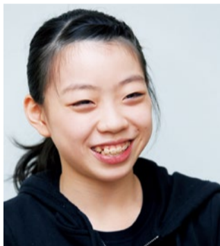
ほぼ毎日4〜6時間のリンク練習にバレエなどのレッスン、そして塾や家庭での学習と大忙し。友達とおしゃべりが息抜きだ。

球団から与えられる背番号は将来への期待が込められたエースナンバー「18」。高卒ながら即戦力として期待されているのがわかる。「自分に自信を持つことは絶対に必要。プロに入ってすぐに通用するかどうかは、やってみないとわからないですが、野球をやっている以上は「楽しむ」という気持ちを忘れずにやりたい。まあ、最初は苦しみとありますが…。それも含めて楽しみです」と寺島選手。プロのバッターから三振を奪う姿を早く見たいものだ。