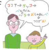
「頭とり」のルール 言葉の頭の文字を取って 繋げていく遊び。

特に低学年の間は、無理に言葉を覚えさせるよりも、楽しいと思える方法で言葉に触れる機会を作ることが大切です。例えば、「尻とり」ならぬ「頭とり」。思いの外難しいのでやり応えは十分。家族で言葉と戯れながら語彙力を鍛えましょう。