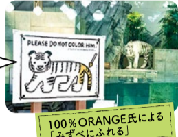
100%ORANGE氏による「みずべにふれる」

同じデザインの塗り絵用紙も無料配布中! 色をぬって、「#ホワイトタイガー」に色をぬってみたい!でインスタ投稿すると、合計3名にポスタープレゼント!