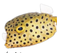
全身ドットの ミナミハコフグ。どれが目かな?