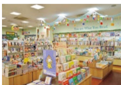
広々とした店内にはカフェスペースのほか、雑貨や文具も揃う。