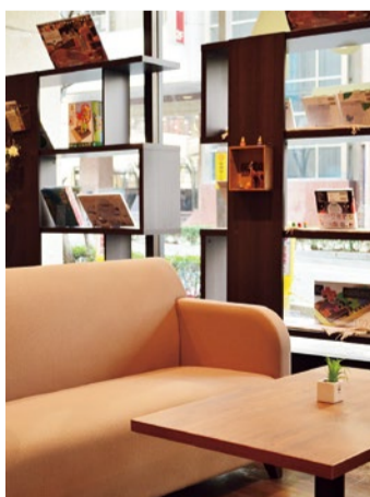
上)店内には椅子が配置しており、気になった本をじっくりと見ることができる。

2015年9月オープン。カフェやソファ、キッズスペースを配した上質な空間には、様々なテーマの本が並び、「食」というカテゴリをとって、サラダやパンといった一つのテーマを深く取り上げる個性的なセレクト。トは、見るだけでも面白い。ギフトとしても使える知育玩具や生活用品もあり、3世代で楽しむことができる。