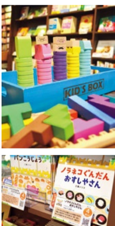
下)絵本コーナーには年齢の目安にコメントが書かれたPOPが。選ぶのに迷えばこれ参考に。