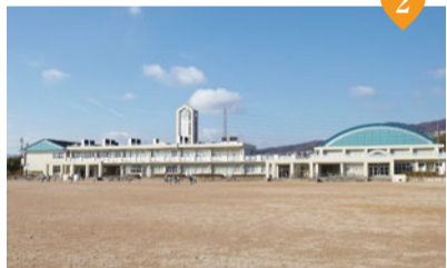
宝塚市立山手台小学校

開校して23年になる宝塚市立山手台小学校。学習の多様化に対応できる広々としたオープンスペースやコンピュータ室、地域に開かれたクラブハウスなどを備え、子どもたちの「生きる力」を育てています。また、山本山手台地区まちづくり協議会が中心に運営する「CoKo center(ココセンター)」では、親子で参加できる様々なイベントが開催されていて、ママ友作りにも一役買ってくれそうです。