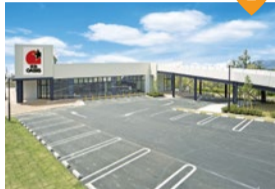
阪急OASIS 宝塚山手台店

高品質な食品が豊富で安心した買い物ができる阪急OASIS宝塚山手台店。普段のお買い物に加えて、山手台ならではのサービスも人気です。その一つが、山手台に隣接する西谷地区から直送される野菜販売。地産地消ならではの新鮮な味が楽しめます。また、電話で商品を注文できる「ご用聞き宅配サービス」も人気。妊婦やご高齢など広い世代の方が暮らす山手台では、とても便利なサービスですね。