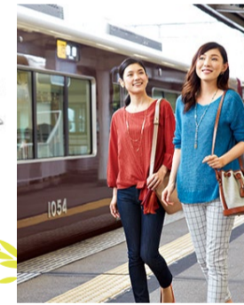
「阪急宝塚山手台」最寄りの「山本」駅は急行停車駅

日常使いできる百貨店「川西阪急」は阪急宝塚山手台最寄りの「山本」駅から2駅の「川西能勢口」駅前。時間も気にせず、ゆったりとお買いものを楽しんで。また、この駅は自然溢れる妙見山まで連れて行ってくれる「能勢電鉄」の始発駅。登山に虫取り、バーベキューと大人も子どもも休日に大自然を大満喫できそうです。