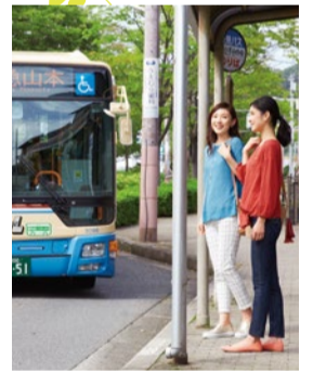
阪急バスが「山本」駅と阪急宝塚山手台を直結