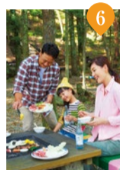
妙見の森「バーベキューテラス」