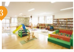
ココセンター内の子育てを支援する山本山手台子ども館