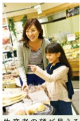
生産者の顔が見える新鮮な食材が豊富