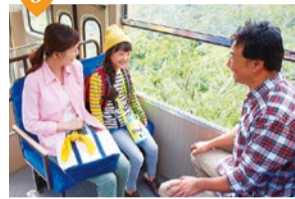
妙見の森ケーブル