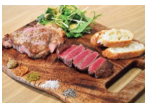
販売価格の+30%でイートインも可能。