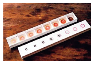
CHOCONIP(チョコニップ) 5,940円(8個入り) 現代美術家・会田誠との共作。少女から熟女へと変っていく乳首の発育過程を8段階で表現したチョコレート。