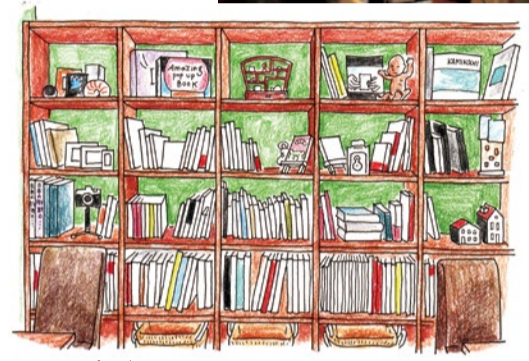
書齋のようなプライベート空間