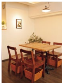
スタイリッシュな内装。