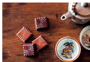
ochocochoco (オチョコチョコ) 1,080円(4個入り) 白鶴酒造とコラボした日本酒チョコレート。日本らしさをイメージしたパッケージにも注目。