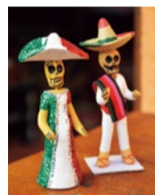
ガイコツドール (1,080円)