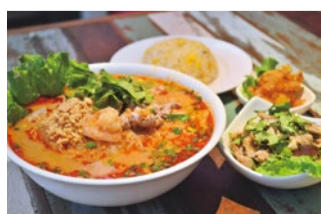
スパシーな見た目は異なり、ヘルシーなトムヤムラーメンのランチセット(850円)