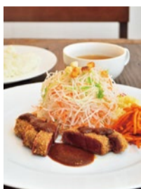
ヘレビーフカツセット (1,150円税別)