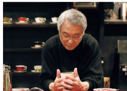
「ミルクや砂糖を入れずにまろやかな味」を追求して生まれた「バターブレンドコーヒー」。全国からこの味を求めて訪れる人が絶えない