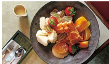
新メニューの「ワッフルとプリン」800円。ホワイトチョコのソースと相性抜群