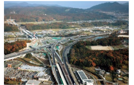
▲神戸JCT付近 2016年11月

N EXCO西日本では数ヶ月に一度、一般の人を対象に高速道路の工事現場等を公開する「なるほど! 高速道路発見」を開催している。高速道路工事への関心や事業への理解を深めてほしいとの目的で始まり、普段は立ち入ることができない橋梁やTNなどの内部を見学できるため、親子に人気を博している。一昨年には建設中の箕面トンネルでも見学会を開き、約30名が参加。今後も、他の事業区間も含めて開催する予定だ。 ※工事中のIC等の名称は仮称。