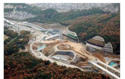
▲川西IC付近 2016年11月