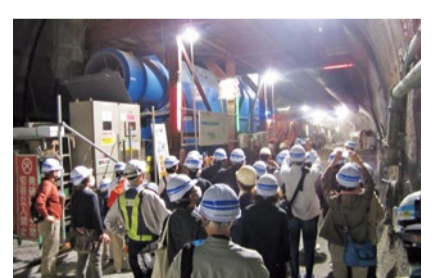
▲「なるほど! 高速道路発見」見学会の様子。