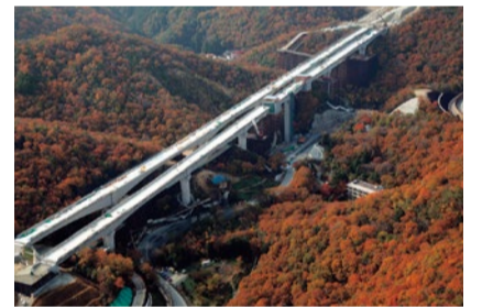
▲宝塚市坊川地区 2016年11月