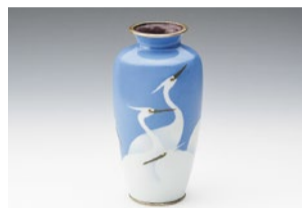
写真は「白鷺図無線七宝花瓶」。ほか、ガラス器や絵画なども並ぶ。

芦屋で30年以上、新・古美術商を営む同店では「色々な人に作品が伝える“美の継承”を体験してほしい」という想いから、月替わりで企画展を実施中。2月のテーマは、今年の干支である「鳥」モチーフの作品。多彩な美術的アプローチを体験してみて。