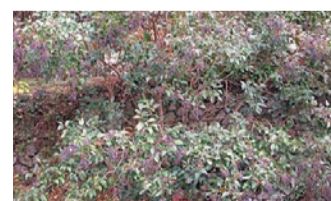
黒くてたわわな実が目引くトウネズミモチ