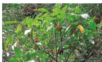
常緑の枝葉と赤い実が美しいアオキ

冬の滝道に色を添える木の実たち。美しい色づかいは、じつは果実を食べる鳥に発見されやすいように発達したと言われています。