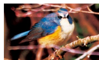
青い実を食べた?青い鳥ルリビタキ

動けない植物は、果実を食べた鳥が遠くへ飛んで行って、糞として種子を落とすことで、分布を広げてもらうのです。