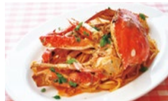
渡り蟹のトマトクリームパスタ 1,800円。渡り蟹をまるまる使い、甲羅から出る出汁や蟹味噌の旨みがつまった贅沢メニュー。

前：骨付き鶏もも肉と豆のカスレ風煮込み 1,480円 後：黒毛和牛を使ったハンバーグと広島産カキフライ 1,780円 ※共にライス付。ディナーのみ提供 サラダ・スープセットは+500円、サラダ・スープ・ドリンクsetは+700円 ※価格は全て税別