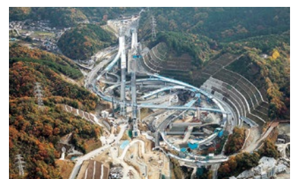
▲箕面IC付近 2016年11月