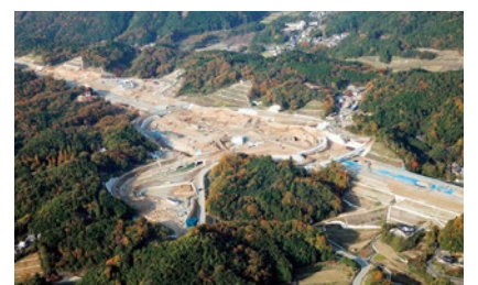
▲茨木北IC・PA(仮称)付近 2016年11月