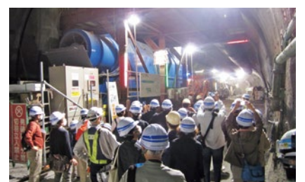
▲「なるほど! 高速道路発見」見学会の様子。