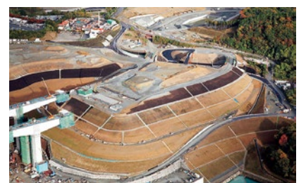
▲高槻第一JCT(仮称)付近 2016年11月

N EXCO西日本では数ヶ月に一度、一般の人を対象に高速道路の工事現場等を公開する「なるほど! 高速道路発見」を開催している。高速道路工事への関心や事業への理解を深めてほしいとの目的で始まり、普段は立ち入ることができない橋梁やTNなどの内部を見学できるため、親子に人気を博している。一昨年には建設中の箕面トンネルでも見学会を開き、約30名が参加。今後も、他の事業区間も含めて開催する予定だ。 ※工事中のIC等の名称は仮称。