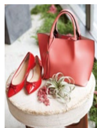
バレエシューズ...13,000円 [chiakikatagiri] / バッグ ...24,000円 [GIANNI CHIARINI]

シャツ...19,000円[TICCA] / Gパン...27,000円[KORAL] / パンプス...49,000円 [NEBULONIE] / パングル ...37,000円[SYMPATHYOF SOUL] / バッグ...29,000円 [GIANNI CHIARINI] / スカー フ...11,000円[manipuri]