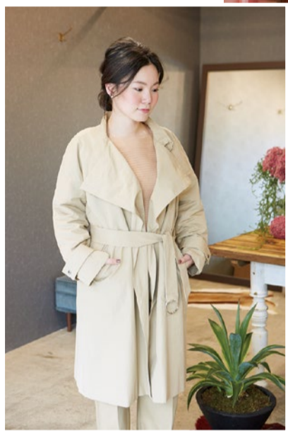
トレンチコート...29,800円[GOUTCOMMUN]