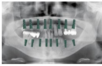
従来のインプラント