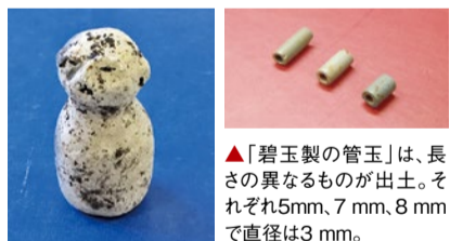
▲高さ5.9cm、胴部径3.0cmの「人形土製品」。丸い頭部と円筒形の胴部から成る。まゆ部分は盛り上がり、両耳たぶには穴が貫通している。

発見された「方形周溝墓」は、周りを溝で囲んだ四角い墓のことで、弥生時代前期、近畿地方に出現した。見つかった埋葬施設には、木棺の一部が残っているものもあった。