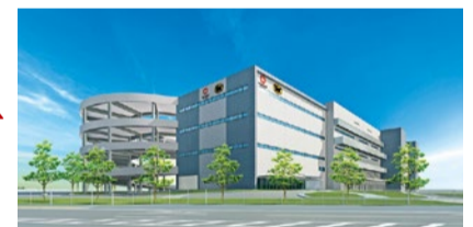
▲関西ゲートウェイの完成予想図

茨 木市内にあるパナソニック工場跡地(松下町1番1)に、今年11月ヤマトホールディングス株式会社が、ヤマトグループ関西最大級の総合物流ターミナル「関西ゲートウェイ」(以下、関西GW)を稼働予定だ。ヤマトグループ各社が入居し、各社の持つ同梱やメン