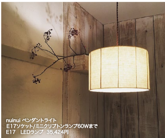
nuinui ペンダントライト E17ソケット/ミニクリプトンランプ60Wまで E17 LEDランプ 35,424円

ミチカケ/ 月のアクセサリ(全5種類) the waxing and waning of the moon 4,860円～