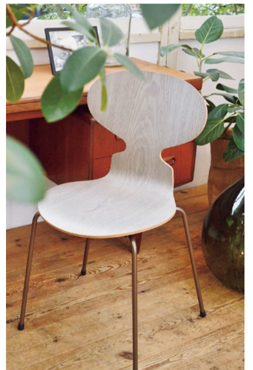
FRITZ HANSEN'S CHOICE 2016 - THE ANTM™ 69,120円(4本脚のみ・2017年8月31日までの限定発売)

民家の並びに突如現れる、北欧デザインの巨匠アルネ・ヤコブセンの専門店。この春はヤコブセンが最初に手掛けたアントチェアの限定カラーに注目したい。シルバークレーのシートシェルに、パウダーコーティングを施したブロンズ色のベースを組み合わせたデザイン。上品で美しく、繊細な印象を与える1脚だ。定期的にも実施するイベントやフェアはウェブにてチェックを。