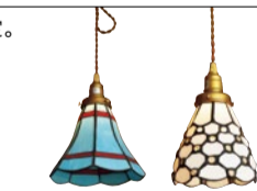
ブルー)14,904円 ホワイト)14,364円