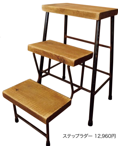
ステップラダー 12,960円