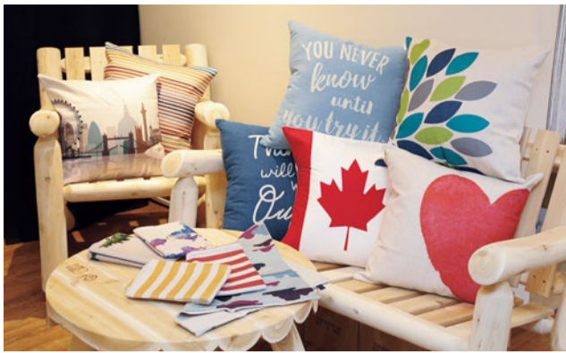
クッションカバー 1,620円～ (Jubilee London他) パークベンチ 41,040円 (Cedar Looks) ロッキングチェア 44,280円 (Cedar Looks)