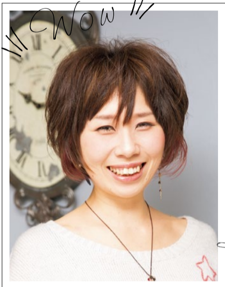
IMAGE CHANGE 軽やか春パーマスタイルに

春は環境の変化で新しい出会い多い季節です。そういう時こそ心機一転、イメチェンをしてみませんか? 変身スタイルが得意なサロンを紹介します。ぜひ、新たな自分を発見してみてください。