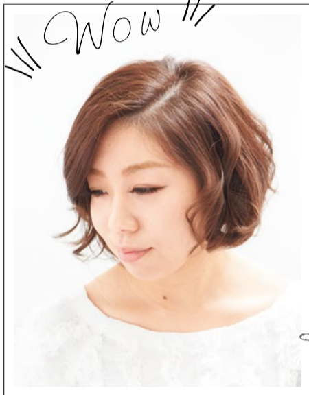
IMAGE CHANGE ひし形ポブで小顔効果を