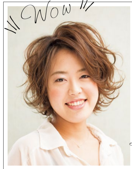
IMAGE CHANGE 長さを変えずここまで変わる