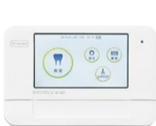
アーレイの「唾液検査機器」

使用すると、虫歯の進行状態が0〜99の数値で表示されますので、肉眼やレントゲンでは発見しづらい初期の小さな虫歯や特殊な虫歯を見つけて削ることができ、必要以上に歯を削らないですみます。その他にも「ペリオテスト」という歯の動揺度(ぐらだけグラグラするか)を測り数値化する機械を使用することで、インプラントや歯周病治療の際、より正確な診断が可能になりました。