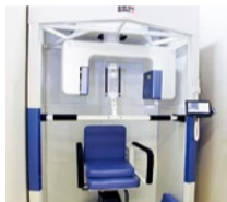
「歯科用CT」これで精密な画像が取得可能に