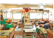
各線元町駅徒歩3分。

マシンの上で横になるだけの手軽さが魅力! 代謝の低下を感じる30~60代に好評。体質改善を促すオーダーメイドプログラムだから、代謝もアップしてリバウンドの心配もなし。週2~3回、120~150分の指導を受けるだけ。7日間3回体験でまずは効果を実感して!