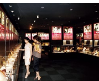
時代を彩ったタカラジェンヌたち。現在も様々な方面で活躍されている人も多い。

入館料 / 500円 営 / 10時～17時(2回公演時は9時半～) 定休日 / 宝塚大劇場の休演日