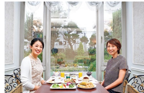
ランチバイキングは平日大人2,600円、土日祝大人3,300円ほか。シニア、こども、幼児料金あり。詳細は下記HP参照または問合せを。