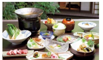
季節の食材を使ったランチ会席(3,900円~)はやさしい味わい。 ※写真はイメージ