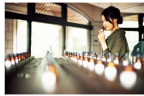
約80種類の天然エッセンシャルオイルの香りくらべ。

入場料 (ロープウェイ乗車料&入園料) ●大人 1,400円 ●小人 700円 (ナイター 大人 800円 小人 500円)