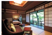
上)この季節、庭のみじは美しい新緑に染まる。今しか見ることができない風景を楽しみたい。 左)森に響く3階の別荘「森の詩」。ベッドルームからは木々の織りなす美しい景観が見晴らせる。

Menu ●ランチ会席...3,900円~ ●すしランチ...2,700円~ ●ディナー会席...8,000円~ ●すしディナーコース...8,000円~ ●宿泊1泊2食付...18,360円~