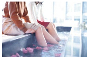
ガーデンで採れた、季節のハーブが浮かぶハーブの足湯でリラックスタイムを。

見た目も美しいハーブ料理を。好みの香りを探すエッセンシャルオイルの香りくらべ、ハーブを取り入れたワークショッなど、五感で楽しめる様々なイベントがスタンプ。夜はライトアップ(土日祝限定)もさ。昼とは異なる幻想的な空間に。生命力に満ちた新緑の森や、色彩溢れるガーデンで春の香りを感じながら、素敵な時間を過ごしてみよう。