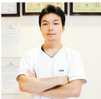
日本では希少な中医薬大学専門課程(5年制)を修了した鍼灸師。

上半身がカッとのぼせる感じがするけれど、下半身は冷えるを感じる。口の中が異常に渇く。寝ても熟睡感が得られない。途中で目が覚める。めまいがひどく気持ち悪くて家から出られない。などの更年期障害の症状に悩んでいる方にお勧めの同院。「鍼灸は漢方薬と同じ治療法で身体に負担をかけずに気血の流れを調える優しい治療法です」と弓削院長。ホルモン剤や抗うつ薬、睡眠薬を使用せずに自然治癒力で治したい方のために東洋医学を修めた院長が鍼灸施術を行う。