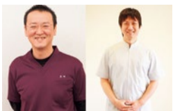
愛媛県・兵庫県の外反母趾専門家も絶賛する外反母趾専門院

「ヒールやパンプスを履くと痛くて歩けない」「病院で手術しかないと言われた」「外反母趾に良いと言われるサポーターの効果がない」といったことで困っている人に朗報!同院では、外反母趾専門の手で行う整体だけでなく「歩行指導」も合わせることでより再発防止と根本原因を取り除いてくれるよ