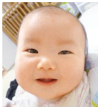
数多くの妊娠実績あり。喜びの声など、詳しくはHPで。

煎じ薬、粉薬の調合も行う北摂でも数少ない漢方専門薬局。子宝相談は評判で同店の得意分野。クチコミで県外から通う方も多く、妊娠した4人に1人が40代という。細かく時期や体調を見ながら、「今」必要な漢方で体を整えていく。医師との勉強会にも参加し日々進歩する生殖医学にも通じており、不妊治療中の方には治療内容に即した漢方を処方してくれるので心強い。