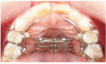
矯正治療で子どもが装着する固定式拡大装置。

正の大きな違いに「成長期」と「成長が終わっている」という点があります。成長が終わると骨が固まってしまうので、成人矯正では歯の並び場所が足りない場合、無理をして歯を並べるか抜歯して歯を減らして並べる「抜歯矯正」になります。一方、子どもは骨がまだ固まっていないので、拡大装置などを使ってあごの骨そのものを大きく育て、足りない成長を取り戻すことで歯の並び場所を獲得します。「非抜歯矯正」が可能になるとともに鼻腔や