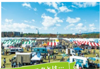
ロハスフェスタとは...

万博記念公園で開催の「オシャレにかわいくエコを実践しよう」と、2006年からはじまったイベント。こだわりの手づくり雑貨や家具、健康的な食材から作られたフード&スイーツなどのブースが400ブース以上並ぶ。5/12(金)~15(月)、5/19(金)~21(日)に開催。