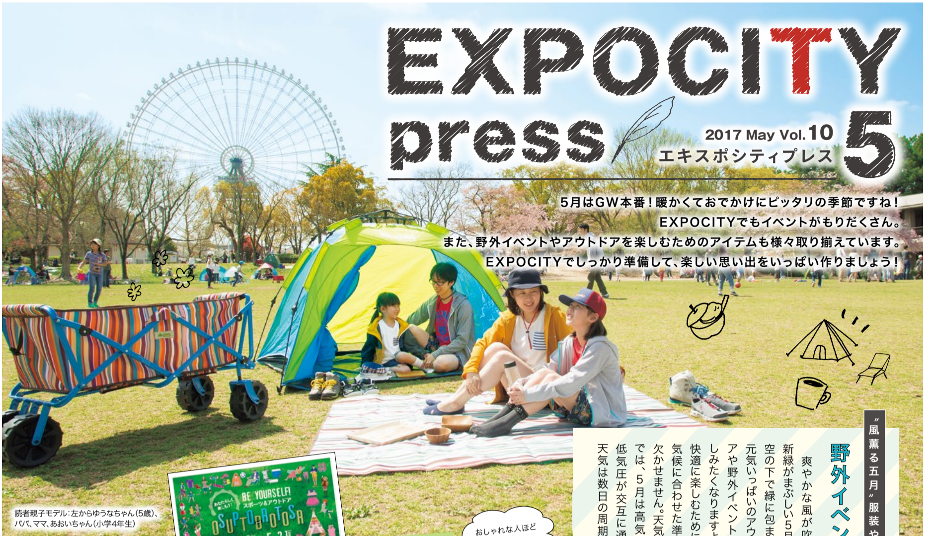
読者親子モデル：左からゆうなちゃん(5歳)、パパ、ママ、あおいちゃん(小学4年生)