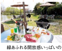
緑あふれる開放感いっぱいのテラス

時間無制限のビュッフェが人気の同店がBBQをスタート!牛もも&カルビ、ジャマイカ風BBQチキン、粗びきソーセージの肉盛りセットにランチビュッフェ付きのセットは読者限定!