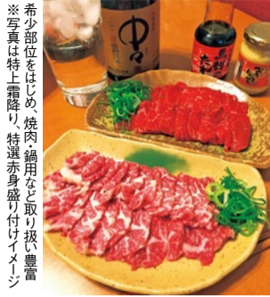
※写真は特上霜降り、特選赤身盛り付けイメージ ※希少部位をはじめ焼肉、鍋用など取り扱い豊富