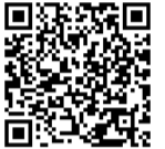
上記からも申し込みできます

下記URLの応募フォームから申し込みください。 各セミナーの状況によって、当日参加も可能です。 ※事前申し込みをキャンセルされる場合は必ず前日までにご連絡ください。 詳細は下記のホームページからチェック!