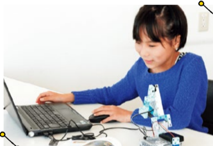
学校教材や教育玩具も製造するアテックのブロックはタテ、ヨコ、ナナメに接続できて組み立ても簡単。