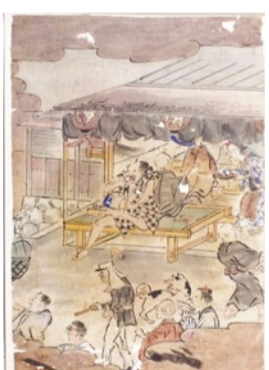
店の前には兵隊のような洋装の男性が登場する