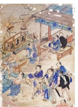
甘酒でご機嫌の客たち