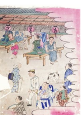
店の前では洋装の警官らしき男性も