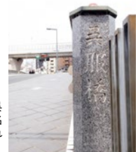
現在の呉服橋前が刻まれた石板

茶店「渋や」があった場所には今は何の痕跡もなく、店があったであろう場所の目の前には国道176号が通っている。呉服橋を取り囲む環境も江戸時代から大きく変化した。「巡礼橋」の名が現在の「呉服橋」へ。そして猪名川の上を巨大な阪神高速道路がまたいで併走する。「渋や」と同じく軒を連ねていた商店も、今はない。