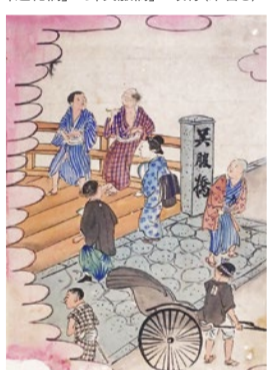
橋のたもとに人力車も登場

力士猪名川 4種類の絵は時代背景が違うのに、共通している。猪名川と千田川とをモデルにした作品で、現在では二段目「稲川内」が上演されている。