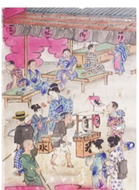
帽子姿の男性や水売りが店前を行き交う