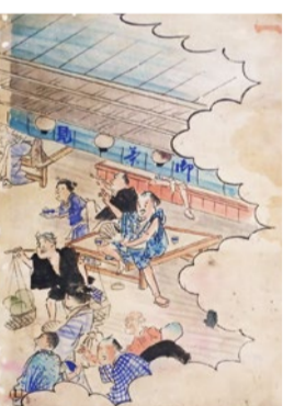
にぎわう店内と行きかう商人ら