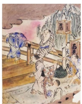
橋の欄干にもたれてくつろぐ人々