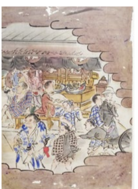
ここでも猪名川関が登場する