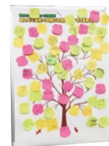
▲ブランドメッセージ(ロゴ)は、イベントなどを通じて得た約2,700人の「茨木の想い」をもとに案を作成。市民投票を経て決定した。

と、ずっと元気なことにすることを目的として、十分に伝わっていないとする市の魅力を市、市民、事業者・団体が丸となって市内外に効果的・戦略的に発信するとしている。「まちのイメージ形成」「まちの魅力の発掘・創造」「情報発信の強化」を3つの柱として位置づけ、市のブランドメッセージ(ロゴ)「次なる茨木へ。」を作成した。また、市内の魅力ある活動内容についてきめ細やかに情報を収集し、インターネットや紙・放送媒体など複数の媒体を活用して、情報発信を強化する。テレビや映画のロケーション誘致なども進める予定だ。