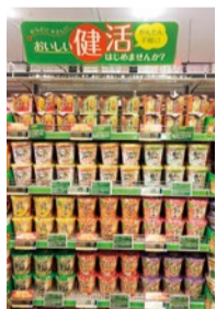
▲同社がすすめる健活コーナー。本品のほか、「スープはるさめ」「Pho-ccori気分」「麺ごころ 糖質50%オフ」「どっさり野菜」などの健康志向をテーマにした商品を多く展開している。

特定保健用食品(トクホ)や栄養機能食品に続き、機能性を表示できる新たな制度。2015年4月より開始された。事業者の責任において、科学的根拠に基づいた機能性を表示する食品として消費者庁に届け出されたもの。