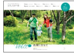
▲定住促進の特設HP「たかつきウェルカムサイト」。 http://www.city-takatsuki.osaka.jp/welcome

も充実していて、古き良き文化が残り、これからの発展もある」と説明する。主要鉄道駅や鉄道車両への広告掲出、インスタグラムを活用した市民参加型企画、各種イベントへのPRブース出展など、それぞれの媒体の特性を生かしたプロモーションを積極的に展開している。