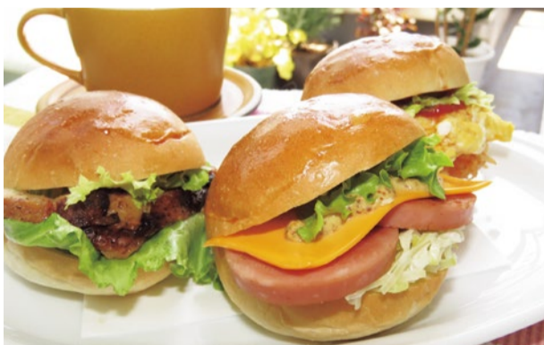
6種類から選べるプチバーガーセット(サラダ・ドリンク付) 2個セット650円、3個セット750円 ※単品200円も販売

小さな多肉植物をはじめ、作家の手作り雑貨も販売するカフェ。ランチは全6種類から選べるプチバーガーセット(サラダ・ドリンク付)がおすすめ。プチバーガーは2個セットや3個セットなどお腹と相談して選ぶことも出来て嬉しい!可愛いグリーン達に囲まれた静かでおしゃれな空間でゆったりとしたひと時を過ごしてみよう。