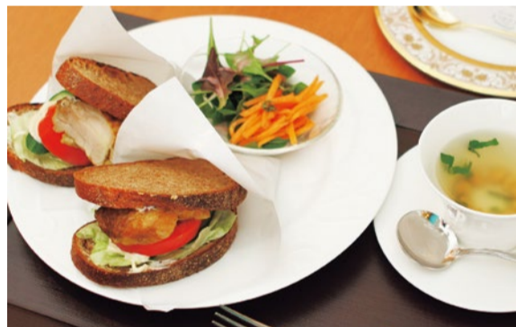
丹波篠山の無農薬有機栽培野菜を使用 芦屋クレイのサンドイッチ(チキン)950円 オーガニック珈琲(HOT/ICE)600円

現代人の食生活は大きく肉食にかたよりがち。体や内臓が悲鳴を上げている人も多いのでは。そこで同店は一部にチキンを使用する以外は、すべて植物性にこだわり、体に負担をかけるない食事やスイーツの提供をコンセプトとしている。無農薬有機栽培野菜をふんだんに使用したサンドイッチや「卵・乳・白砂糖不使用」の美スイーツなど、美と健康を意識した食事を楽しんでみよう。