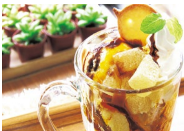
人気スイーツ!オレンジ&チョコパフェ 650円 ※葛を使ったふるふる食感の寒天入り