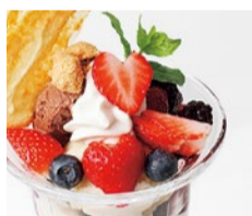
人気の美スイーツ ザ・スタンダードパフェ 「ベリー・ベリー・ベリー」1,280円