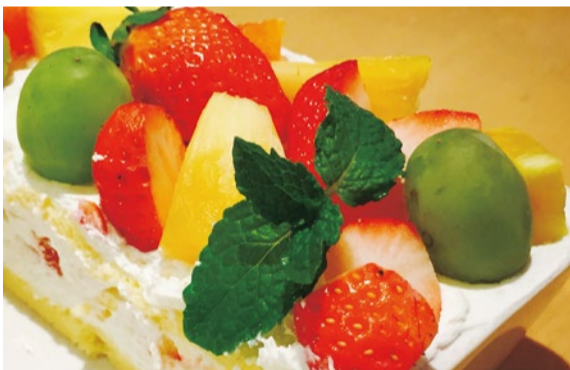
フルーツ沢山のトライフルケーキセット650円

【特典】「シティライフを見た」と来店の方、ケーキセット650円→500円(6月末まで)