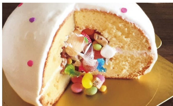
サプライズ感バッチリ!くす玉ケーキ:クリーム3,024円、生チョコクリーム3,564円

【特典】「シティライフを見た」とランチの方、 ドリンクセット(108円)無料! (6月末まで)