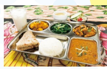
ダル(豆カレー)とおかずも混ぜて食べるネパールの定番。ダルパートセット(1,010円)

Indian & Nepali Restaurant Narayani (インド・ネパールリョウリ ナラヤニ)