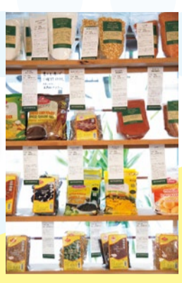
店内に並ぶ様々なスリランカのスパイス。輸入販売も行っている

スリランカに魅せられた店主が作るスリランカ式ライス&カレーのお店。「鯖(骨付き)カレー」は唐辛子や黒胡椒がガツンと効いた辛口で、酸味もあるスッキリとした味わい。マイルドな豆カレーや野菜のお惣菜と好みで混ぜながら食べるとやみつきに。