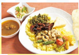
カレー5種類を少しずつ混ぜて味わうワイルドプレート(1,480円)