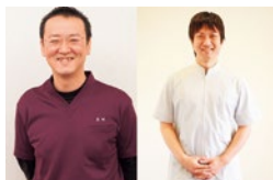
愛媛県・兵庫県の外反母趾専門家が絶賛する外反母趾専門院