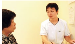
日本では希少な 中医薬大学専門課程(5年制)を修了した鍼灸師。