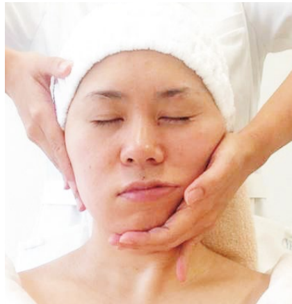
田中有久子先生から受け継ぐ数種類のハンドマッサージにより、静脈やリンパへ老廃物を確実にオフ。ストレスや肩・首のコリ、目やごの疲れも同時に改善されるのがうれしい。大好評につき、1ヵ月前の予約がオススメ。

日々研鑽を積んだエステティシャンのハイレベルな技術力、ラゲジユアリーな雰囲気、心地よい接客。何もかも申し分ない上に、世界的に著名な田中有久子先生が開発した「造顔マッサージ®」の正規継承サロンとしても圧倒的な支持を得ているグランモア。たるみ・むくみ・しわ・ほうれい線といった年齢とともに深まる悩みが一度でスッキリ、たった30分なのに小顔&アンチエイジングの効果が期待できる。その成果のヒミツは、ストレスや首・肩のハリ、噛みグセなどで硬くなり、血流やリンパが滞りがちな顔の各部位に働きかけるから。熟練のオールハンドで皮膚表面だけでなく筋肉にまで圧を加え、顔に溜った老廃物や脂肪を押し流し、しっかりとデトックス。